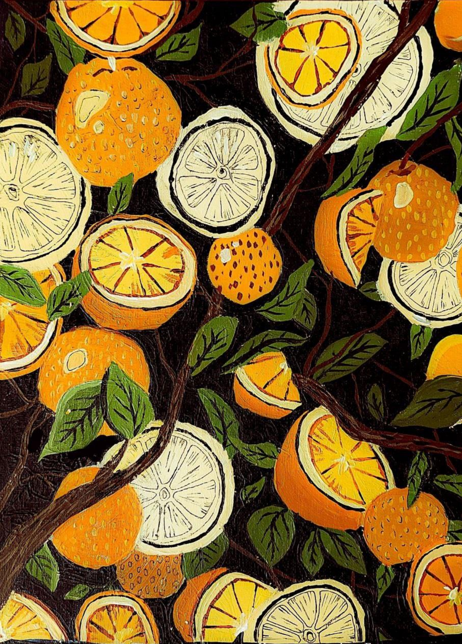
Иллюстрация: Луиза Ермакова