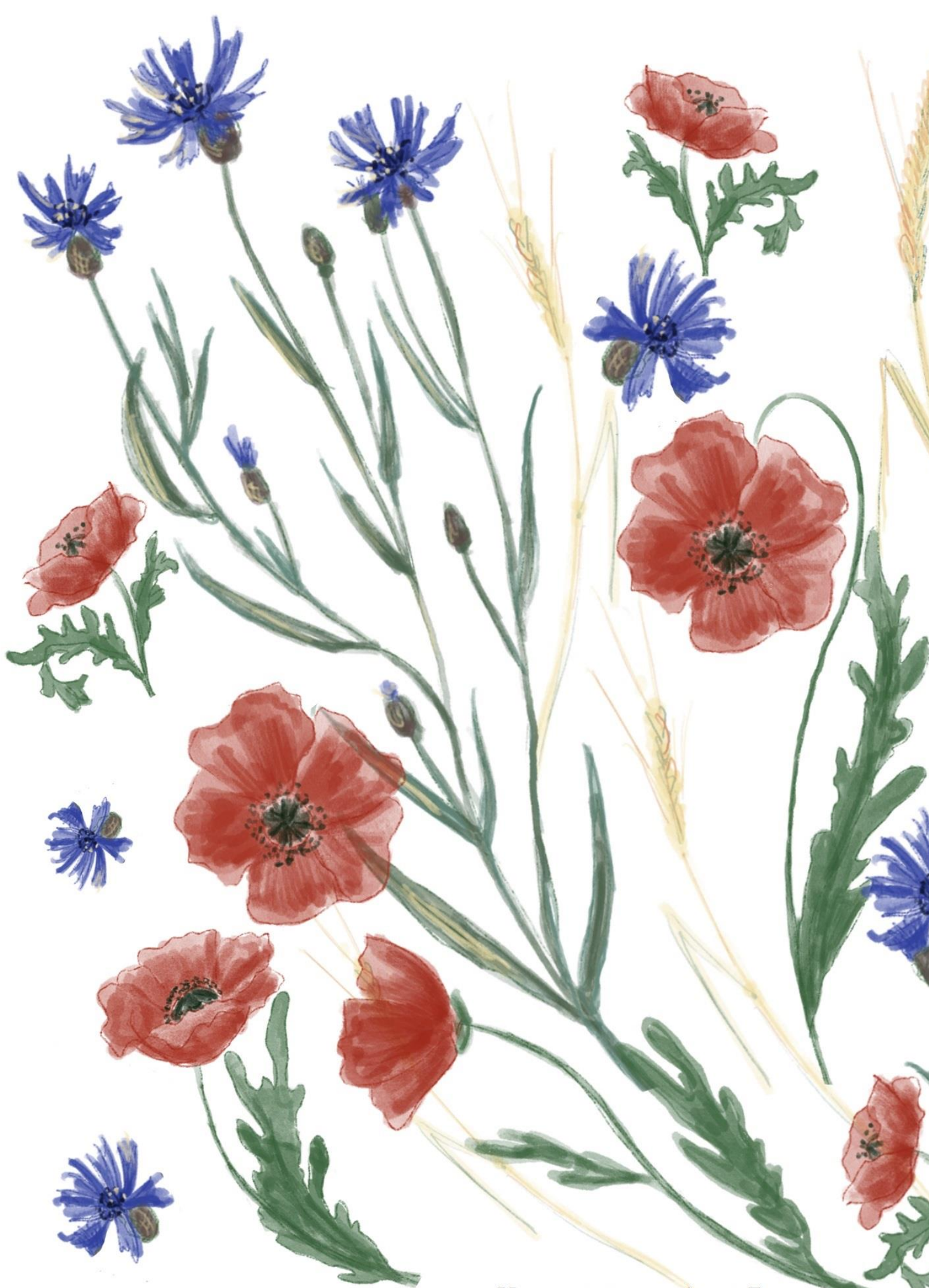
Иллюстрация: Анна Боронина