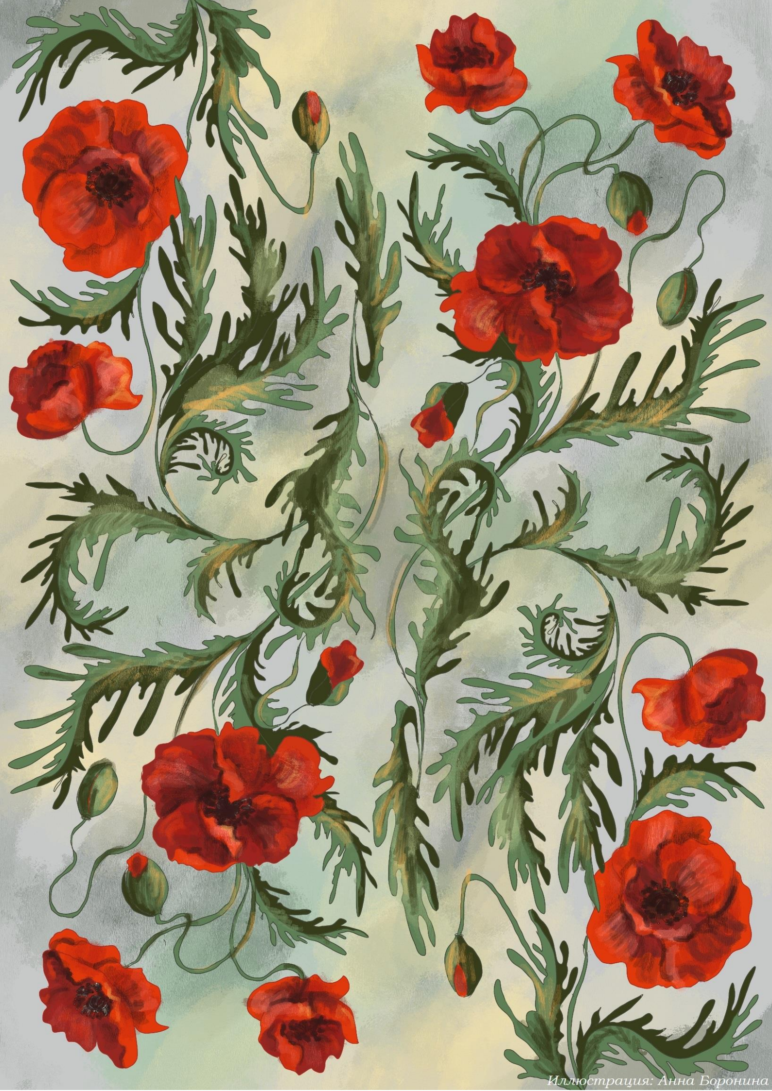
Иллюстрация: Анна Боронина